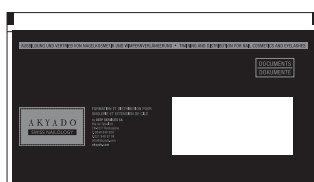
C6/5 Zone de publicité 235 × 120 mm Impression en 2 couleurs (Noir, «Silber Pantone 877»)